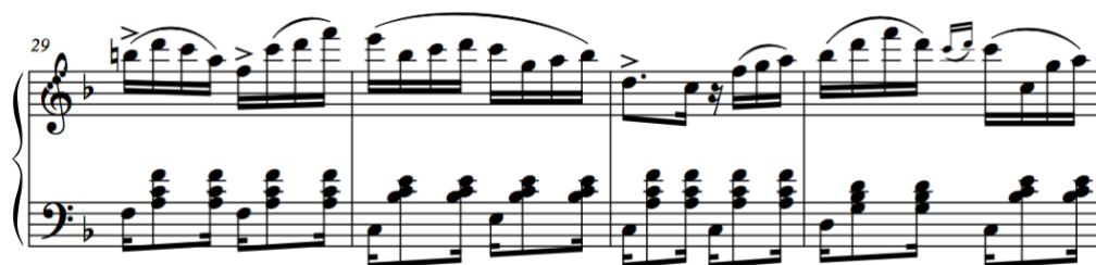
Figura 3: Notas rápidas na mão direita do tango Água do Vintém , de Chiquinha Gonzaga, compassos 29–32.