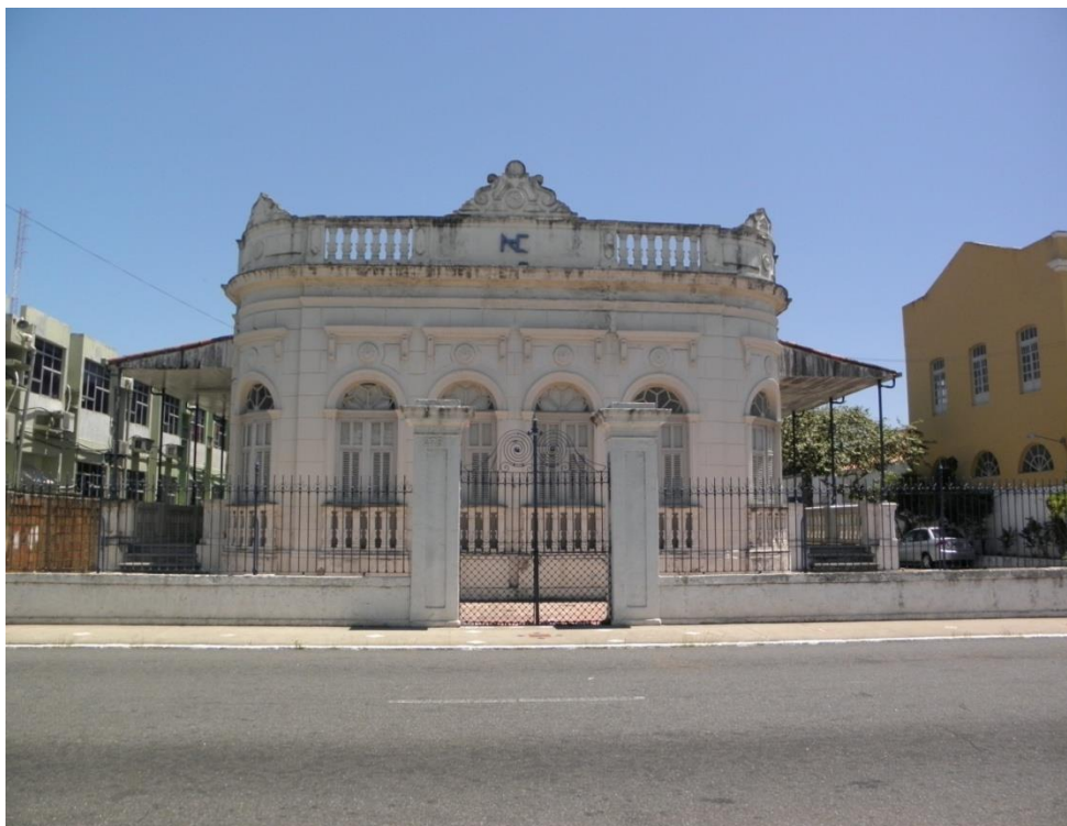
Figura 3: Prédio onde funcionava o curso de música da UFPB na Rua das Trincheiras, 275, ao lado do teatro Lima Penante.

Foto realizada em 17 de novembro de 2012.