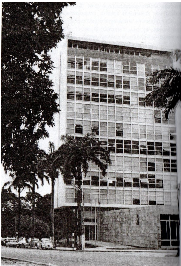
Figura 2: Prédio da Reitoria na década de 1960, onde funcionou o Curso de Música da UFPB. Parque Solon de Lucena (Lagoa), no centro da capital.