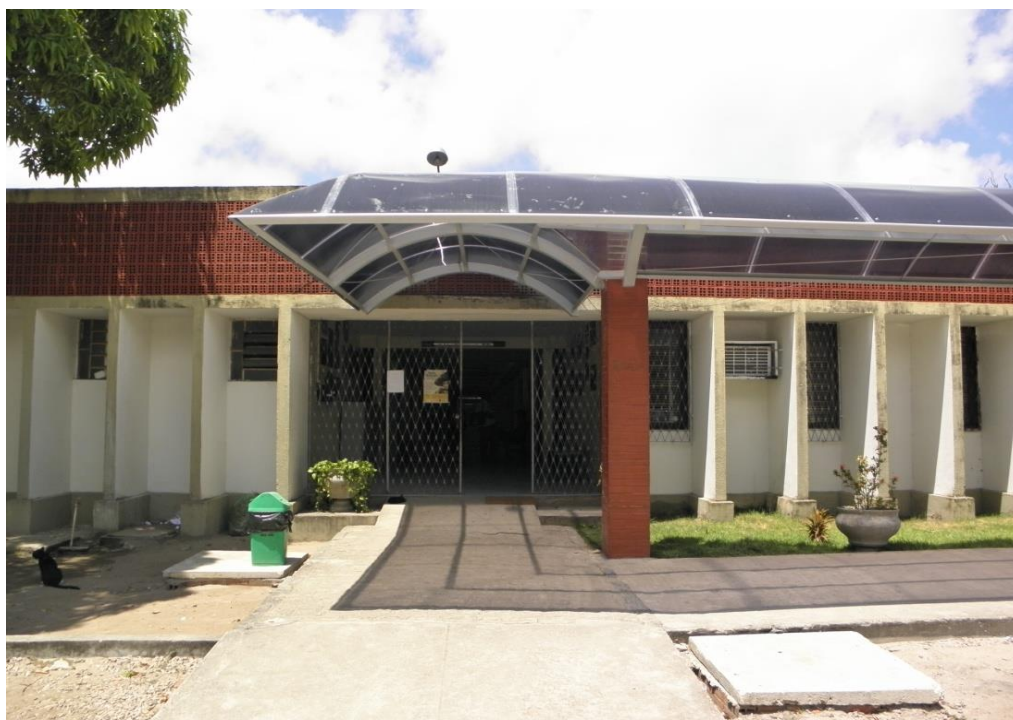
Figura 5: Detalhe da fachada e entrada principal do prédio onde funciona o Departamento de Música da UFPB, no Campus I.

Fonte: Acervo da autora. Foto de 26 de novembro de 2012.