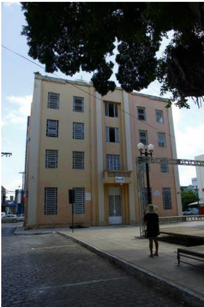
Figura 1: Atual prédio da FUNAPE onde funcionou o Curso de Música da UFPB na década de 1960.