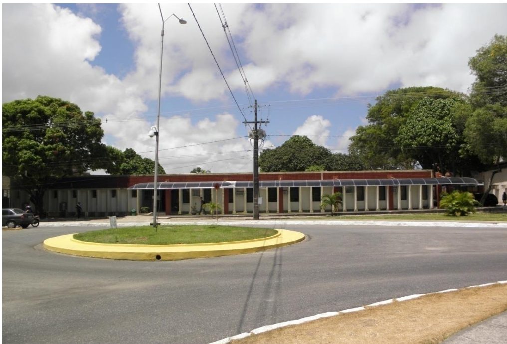
Figura 4: Aspecto panorâmico do prédio onde hoje funciona o Departamento de Música da UFPB, no Campus I.

Foto de 26 de novembro de 2012.