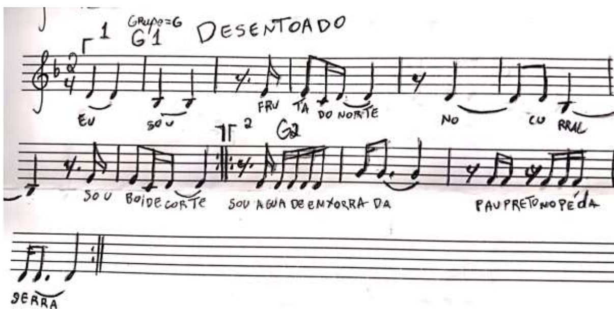
FIGURA 3 – Transcrição da gravação do Grupo Raízes 1974

Após a apreciação, a letra foi escrita no quadro negro como na aula anterior, e a partir do refrão, foi feita a leitura, e a interpretação do texto, refletindo sobre a descendência, dos presentes na sala de aula, pensando na história dos avós, pais e mães dos próprios jovens ali presentes. Cada um relatou brevemente de onde seus parentes mais próximos são nativos, e quais foram seus modos de produzir a existência durante a vida, chegando a conclusão que éramos todos descendentes de trabalhadores rurais das regiões do Nordeste, Centro-oeste, e sertão norte mineiro.