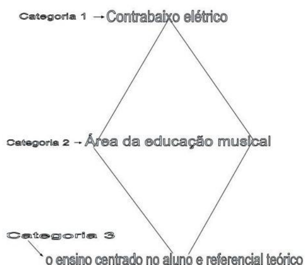
Figura 1 - Esquema representativo do estado do conhecimento

Na Figura 1 buscamos representar, em forma de losango, o roteiro da nossa pesquisa. Na parte inicial da figura traçamos um estreitamento apenas com pesquisas sobre o ensino do contrabaixo elétrico. Na parte central temos o apontamento de pesquisas mais abrangentes que envolvem o ensino de outros instrumentos, e na parte final o estreitamento para o referencial teórico da pesquisa mencionada neste artigo.